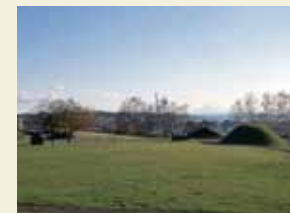
入江・高砂貝塚[入江]