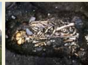
入江・高砂貝塚[高砂]