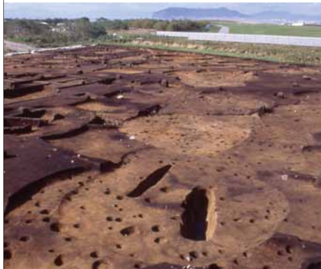
約9,000年前の集落跡 中野B遺跡(函館市)

ヤンガー・ドリアスの寒冷期が去った約9,000年前になると、竪穴式住居で構成された集落が各地で確認されるようになります。道東部の八千代A遺跡(帯広市)や道南西部の中野B遺跡(函館市)では多くの竪穴式住居跡がまとまって発掘されるなど、すでにこの時期には恒常的な定住地が形成されていたことが分かっています。