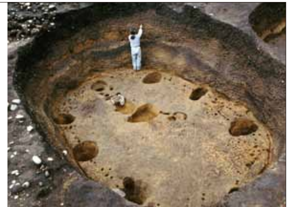
大型の竪穴住居跡 大船遺跡(函館市)

北海道を地理的にみると、北東部はサハリン島や千島列島などを通じて北方世界と接し、南西部は津軽海峡を挟んで本州と向き合っています。このことから、古来、北海道は北と南の文化が流入し交差する舞台になっていました。また、森林植生の相違も北海道の縄文文化の発展のあり方に影響を与えたと考えられます。落葉広葉樹林が広がる南西部には、ほぼ同じ植生をもつ東北地方を中心に発達し、クリの栽培などを伴ういわゆる「円筒土器文化」が6,000年ほど前から流入し、津軽海峡の両側に南北約500kmに及ぶ広大な文化圏を形成しました。これは他の縄文時代の地域文化圏に比べて広域で安定したものであり、先史時代における文化圏内の価値観の交流を示す顕著な事例として注目されます。