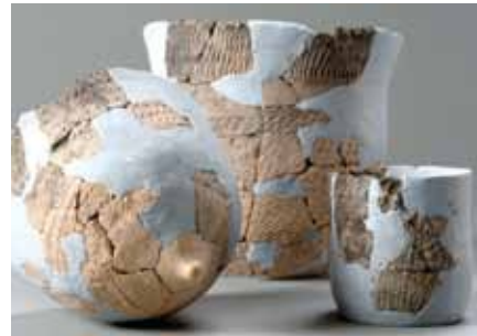
北海道最古の土器 大正3遺跡(帯広市)

北海道で最も古い土器は、道東部の大正3遺跡(帯広市)から出土したもので、放射性炭素による年代測定で約14,000年前という年代値が得られています。この土器は乳房状の突起を持つ丸底の形をしており、縄目ではなく、爪形の紋様が施されています。この形と紋様の特徴は本州の土器に共通していることから、初期の縄文文化においては、北海道東部に至るまで本州とほぼ均一の文化要素が広がっていた可能性を示しています。北海道ではこの段階の住居跡はまだ見つかっていませんが、列島の各地ですでに竪穴式住居が出現していたことが知られています。