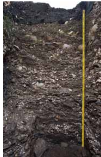
貝層の堆積状況 北黄金貝塚(伊達市)

その後、6~7千年前に温暖化のピークを迎えると、海水面の上昇と内水面の拡大により漁労が一層発達し、道東部の東釧路貝塚(釧路市)、道南部の北黄金貝塚(伊達市)や入江貝塚(洞爺湖町)のような貝塚を伴う集落が増加し、さらに5,500年前頃から大船遺跡(函館市)のように大型の竪穴式住居が密集した大規模な集落も形成されるようになります。